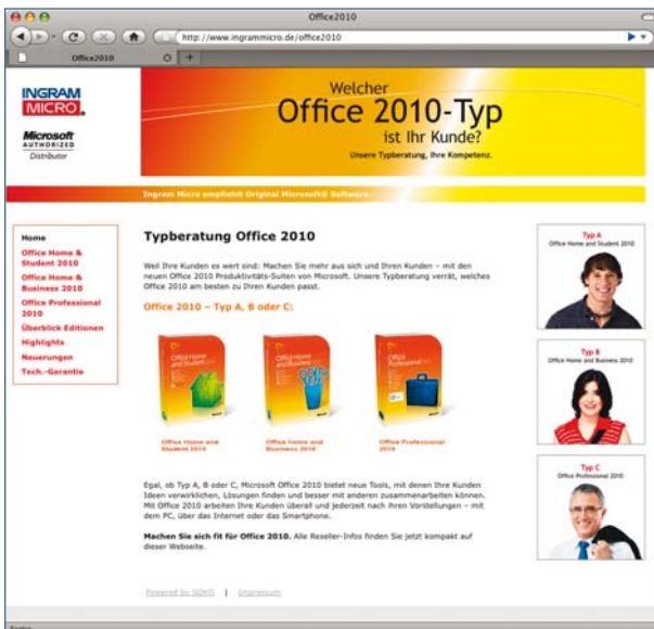
Website (auf Basis TYPO3)