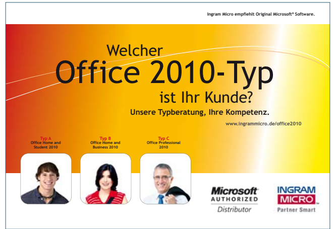
Broschüre, DIN A5, 4/4c